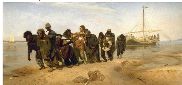
И.Е. Репин «Бурлаки на Волге» 1870-1873 гг.