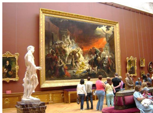
К.П. Брюллов «Последний день Помпеи» 1833 г.