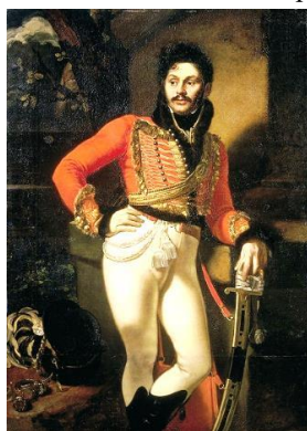
О.А. Кипренский «Портрет Е.В. Давыдова» 1809 г.