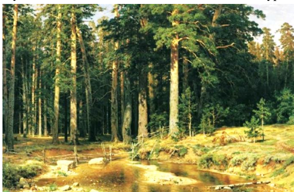
И.И. Шишкин «Корабельная роща» 1898 г.