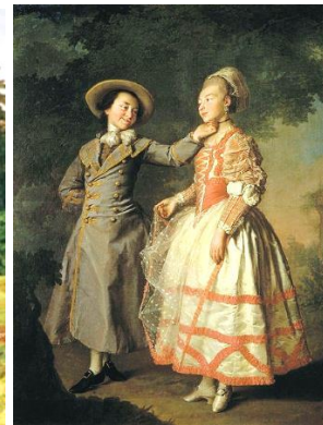
Д.Г. Левицкий «Портрет Е. Хрущевой и Е. Хованской» 1772-76 гг.