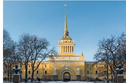
А. Зубов «Адмиралтейство» 1716 г.